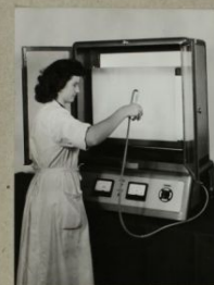
IPARI FORMATERV VERTIKÁLIS PAPIR- ELEKTROSTATIKUS KÉSZÜLÉK KIINDULÓ MINTA MŰVELET