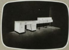
IPARI FORMATORV KOMPLETT KROMATOGRAFIS ÉS ELEKTRO- FORTIKUS LABORATORIUMI BEREKSZÉSI FORMATORV VÁLATA