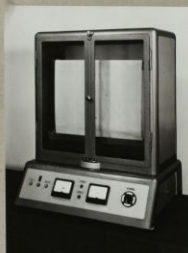
IPARI FORMATERV VERTIKÁLIS PAPIR- ELEKTROSTATIKUS KÉSZÜLÉK KIINDULÓ MINTA