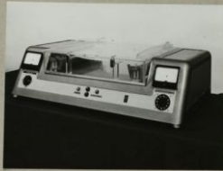
IPARI FORMATERV HORIZONTÁLIS PAPIR- ELEKTROSTATIKUS KÉSZÜLÉK KIINDULÓ MINTA